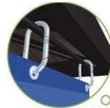
軒下のガイドレールにシートを取付けます。