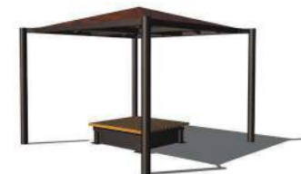
● 緑台はオプションです。

災害時には簡易テントとして、避難所、集会所、救護施設など多目的な利用が可能です。収納ボックス付緑台(BO-1212)を設置すればシート、取付フックなどを収納できます。